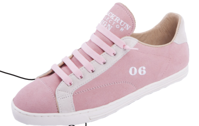
MODÈLE 06 NICE