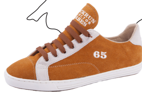
MODÈLE 65 TARBES