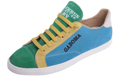
MODÈLE LBV GABON