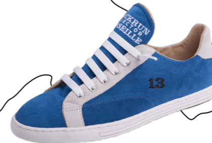
MODÈLE 13 MARSEILLE