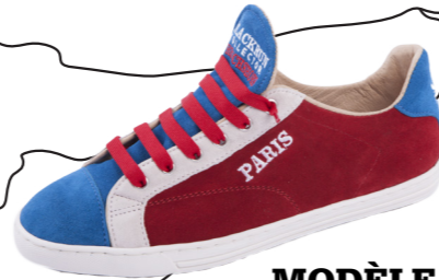
MODÈLE P. PARIS