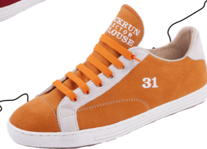
MODÈLE 31 TOULOUSE