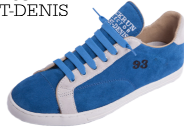
MODÈLE 93 SEINE-ST-DENIS