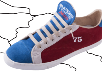
MODÈLE 75 PARIS